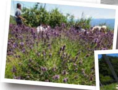
ブルーベリー&ラベンダー (平成27年)