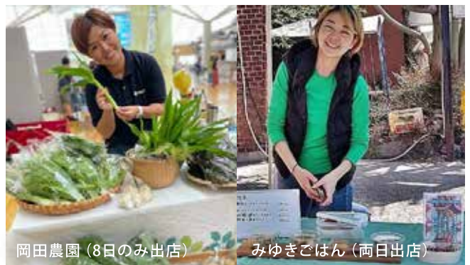
岡田農園(8日のみ出店)

そのほか、大府発祥のコグニサイズ体験をはじめカラダを使うワークショップもあります。時間は同封のチラシや弊社ウェブサイトでもご確認ください。