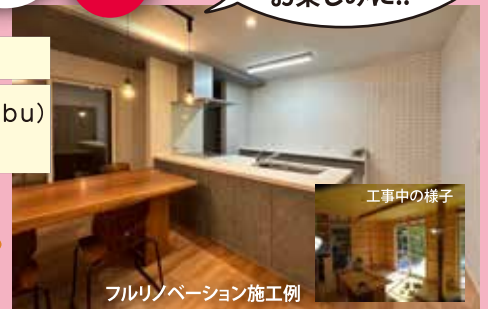
フルリノベーション施工例

おうちもアップデートしませんか? 大切な家のこと、考えてみる2日間です 図書館ついでに、お立ち寄りください!